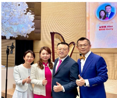
圖一：2021.10.10 611 第五屆按牧禮