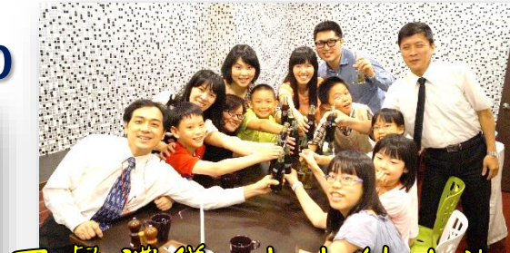
西餐禮儀：小小紳士淑女