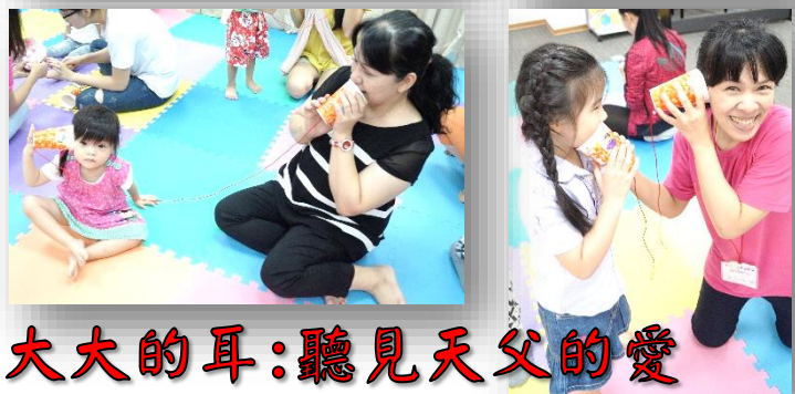
大大的耳：聽見天父的愛