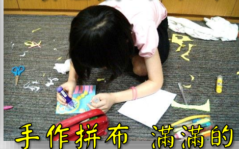
手作拼布 滿滿的愛