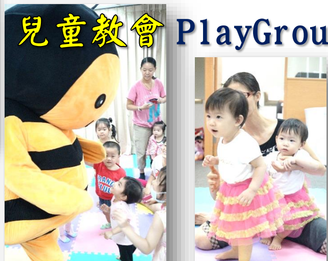
大大的口：說出讚美的話